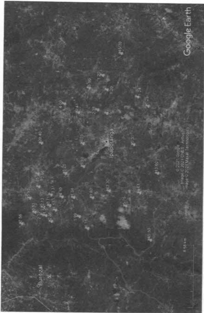
1 PLANTA DE LOCALIZAÇÃO SEM ESCALA