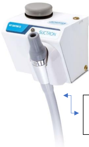
KIT SUCTO, COM SUGADOR E FILTRO