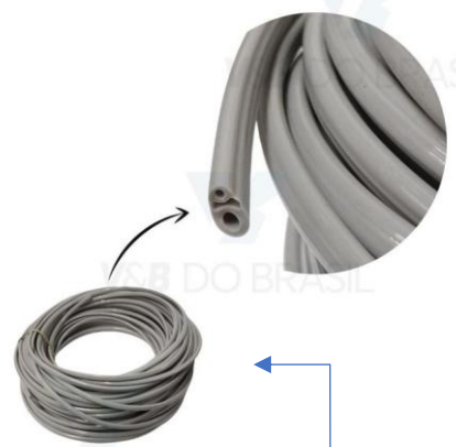
MANGUEIRA PARA SUGADOR