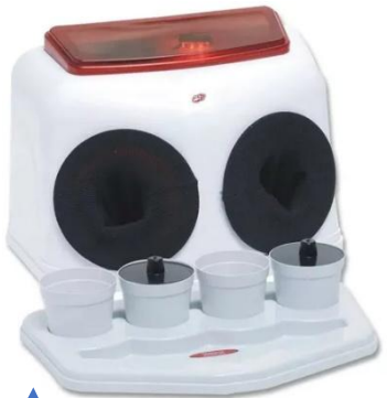
CÂMARA ESCURA REVELAÇÃO