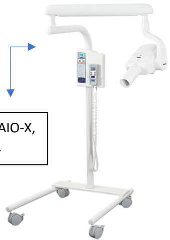
APARELHO DE RAIOS-X, COLUNA MÓVEL