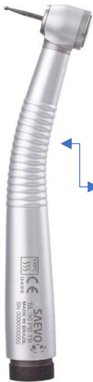
CANETA DE ALTA ROTAÇÃO