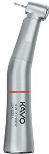
CANETA DE BAIXA ROTAÇÃO